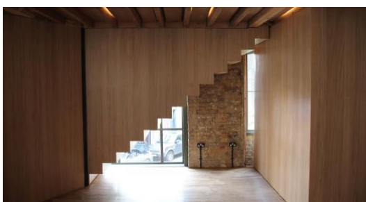
Til indendørs brug