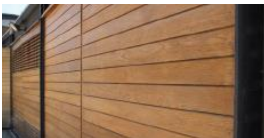
Til udendørs brug

Rekvirer tekniskdatablad, påføringsdatablad samt MSDS (Arbejdshygiejnisk datablad) fra teknisk afdeling.